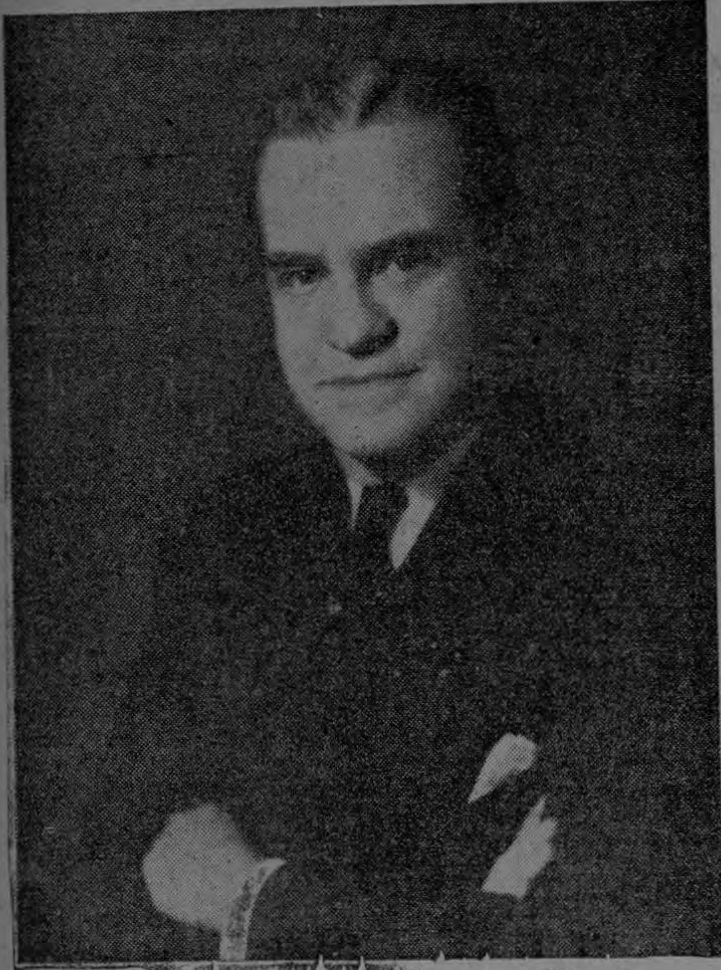
DON ENRIQUE ADOLFO JIMENEZ Presidente de Panamá