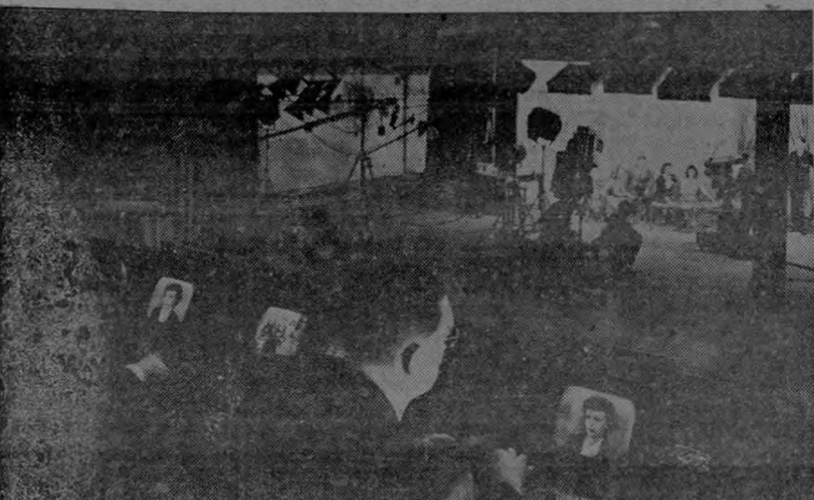
Vista del Cuarto de Control en los estudios de televisión del C.B.S.