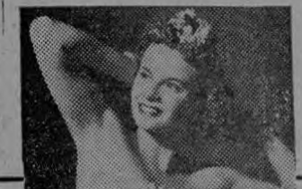
ARRID es la crema blanca, inocua, que no irrita