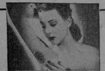
Piel irritada por sudor fuerte debajo de los brazos